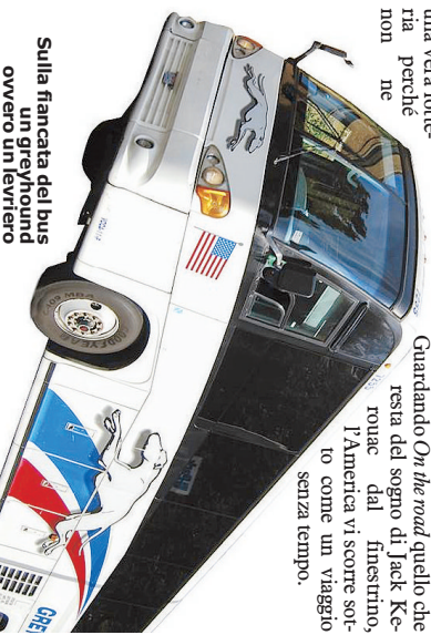
Sulla fiancata del bus un greyhound ovvero un levriero

Oggi la concorrenza verso i colossi di "FirstGroup" la società inglese che ne possiede il marchio, si è fatta spietata. Per raggiungere le spiagge degli Hampton's dei ricchi bisogna bypassare il dominio di "Hampton Interney". Ma se per lungo tempo dai loro quartier generali di Dallas i "levrieri" erano scatenati la guerra dei low cost anche per i motori con Mercedes (Nord America) una consociata di Coach USA che dalla sua sede in New Jersey, soprattutto per la East Coast, ribatte colpo su colpo, scono su scono, promozione su promozione quasi a voler esercitare una concorrenza più silenziosa, ma efficace che diverse compagnie cinesi hanno intrinsecato partendo da Canal Street