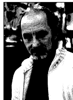
AUTORI DI PUNTA